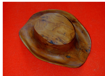
Hoed uit taxushout

Zo'n 4 tot 5 keer per jaar organiseert hij of neemt hij deel aan tentoonstellingen in België en Nederland. In beide landen worden jaarlijks tentoonstellingen gehouden onder de naam 'Open Dag Hout', waar niet commerciële houtbewerkers met verschillende invalshoeken hun scheppingen aan het publiek tonen en onderling ervaringen uitwisselen. Om zijn huis en het pand waarin zijn werkplaats is gevestigd ligt een enorme voorraad hout opgeslagen in de vorm van stamstukken, grote en kleine blokken van diverse soorten. Achter zijn werkplaats bevindt zich verder nog een 20 m lange overkapping waar hout ligt te drogen. Het zijn zoveel kubieke meters, dat Omer drie