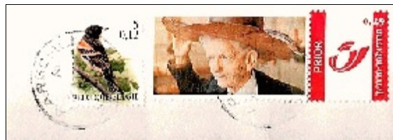
Postzegel uit een serie van 9 houten hoeden

houtsoorten betrekkelijk licht zijn. De hoeden zijn tentoongesteld in zijn Toonzaal. Vermeldenswaard is dat in 2003 een serie van negen postzegels met afbeelding van Omer's mooiste hoeden in België werd uitgegeven.