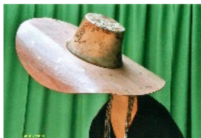
'Venice', hoed uit lindenhout en finer

Al gauw kwam hij er achter dat het houtsnijwerk aan zijn modellen te gelimiteerd was en onvoldoende voor creatieve expansie. En dat luidde de tweede fase in waarin hij zich toelegde op het vervaardigen van houten klokken in alle vormen en maten. Het werden er honderden! Bij het maken van zijn klokken kwam hij alle facetten van de houtbewerking tegen en vooral het aspect van het draaien. Later werd het draaiwerk gecombineerd met het snijwerk; door toepassing van verschillende methoden daarin, was dat de oorzaak van de grote diversiteit in zijn scheppingen.