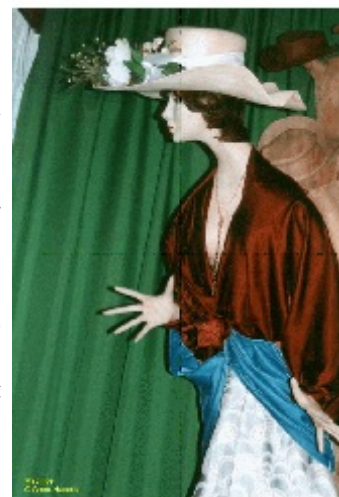
'Mathilde', hoed uit populieren

De laatste 7 jaar is Omer's specialiteit 'hoeden', houten hoeden voor dames en heren, vaak in eigen ontwerp. Soms wordt een speciale replica gemaakt. In de collectie van ongeveer 50 verschillende hoeden vindt men een hoge hoed, een baseballpet, een jockeypet, een replica van een van de hoeden van Koningin Elisabeth en vele elegante dameshoeden. Hun aanzien heeft een frappante gelijkenis met echte hoeden! Hij ontwierp zijn eigen gereedschappen om de hoedranden te kunnen maken. Met uitzondering van Afrikaans padoek , zijn alle hoeden vervaardigd van inlandse houtsoorten, veelal populieren, noten, citroenhout en tamme kastanje, omdat deze