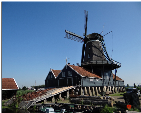
Houtzaagmolen 'de Rat' in IJlst met er voor het balkengat

Zo verkrijgt de oppervlakte van ieder oud of antiek houten kunst- of meubelstuk een patina dat kan worden beschreven als een soort 'bezoedeling' van het uiterlijk, veroorzaakt door zijn leeftijd, ouderdom, gebruik en blootstelling aan natuurlijke elementen. Zo is het ook belangrijk dat een viool lang wordt bespeeld, totdat deze haar volle klankkleur heeft ontwikkeld. Zo is een barokmeubel al levendig wanneer de schrijnwerker zijn tijd, zijn zorgvuldigheid, zijn wezen er in heeft verlevendigd. Daarom is een kast van spaanplaat geestelijk leeg, want deze door een machine en zo mogelijk in 'geen tijd' is vervaardigd. Een modern fabrieksmeubel is het 'mooist', wanneer het net uit de werkplaats komt. Andere meubels worden steeds mooier hoe meer eeuwen er in steken. Bijvoorbeeld de dikke eikenplank van de eettafel, die meer dan tien jaar in de keuken ligt, deze bevat de geschiedenis van het huis en zijn bewoners. De schoolbank, de kerkbank, de werkbank, zij zijn getuigen van zorg en leed van uren, weken, maanden en jaren. In de jaarringen van hout ligt een chronologisch omvangrijk tijdsbeeld vast dat een deel van onze geschiedenis weergeeft. Het slaat de tijd tezamen met veel identificeerbare gegevens in zijn jaarringen op.