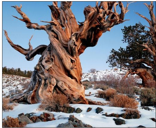
Bristlecone Pine 'Metusalem', 4.841 jaar oud, in de White Mountains, Californië

Kleve, zomer 1999 Tjerk Miedema miedematj@aol.com